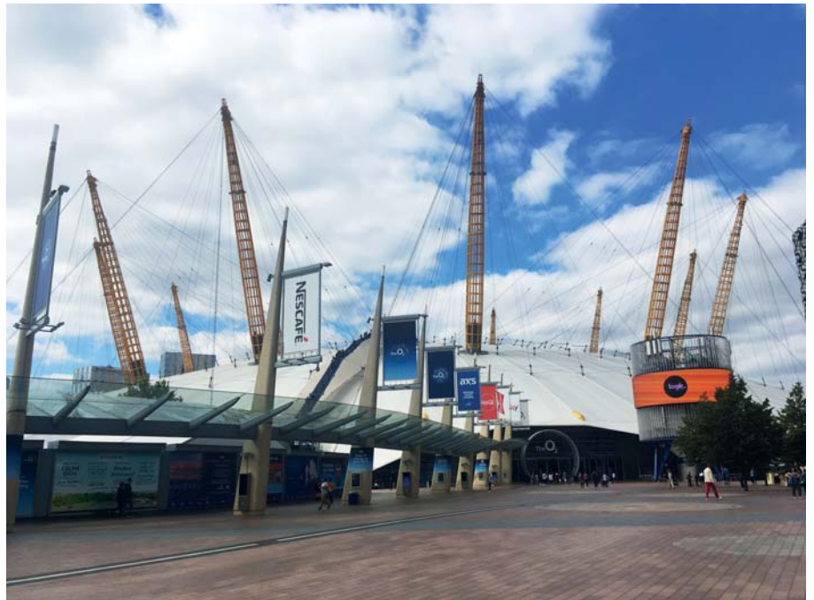
Arena O2 “the Dome”

Con el transcurrir de los años, la ruta terminada conectará cada nuevo vecindario de la península. Desarrollado en dos niveles, The Tide, invita a hacer actividades como pasear, entrenar e incluso disfrutar de obras de arte al aire libre.